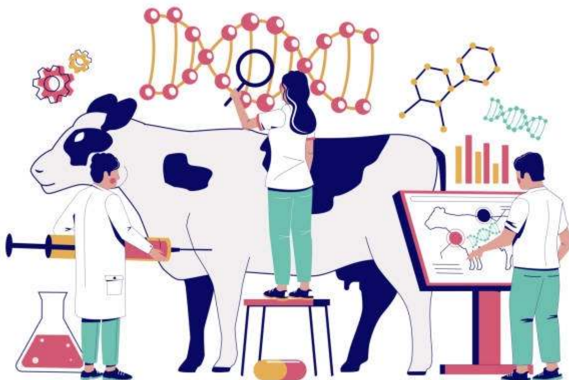
GENETICALLY MODIFIED ANIMALS